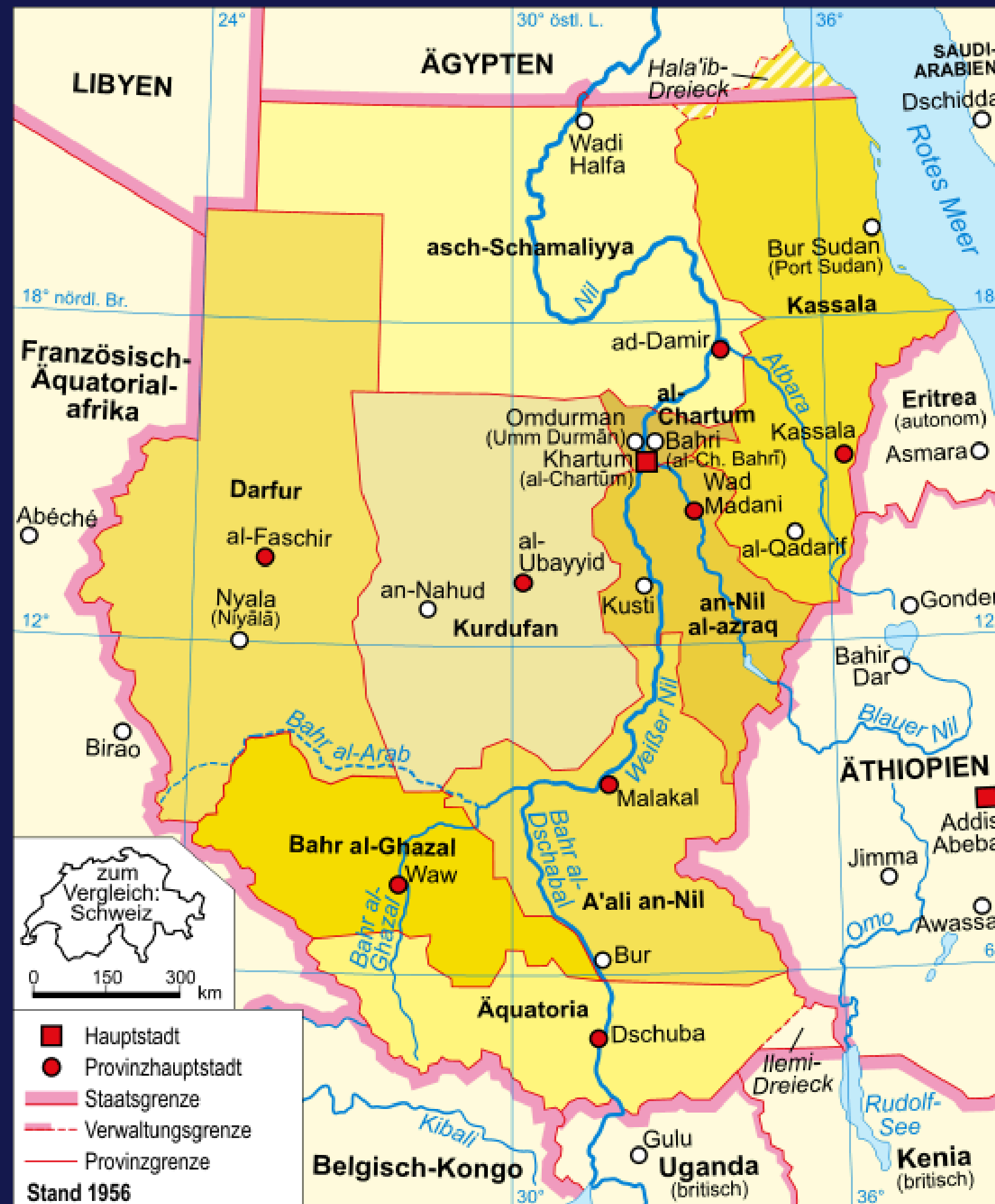
by Domenico-de-ga, published under GDFL license